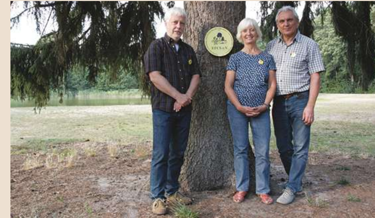
Vorstand des EFCS e.V.

Als besondere zukunftsweisende Aufgabe erachten wir das Heranführen von Kindern und Jugendlichen an Pflege und Achtung der Natur.