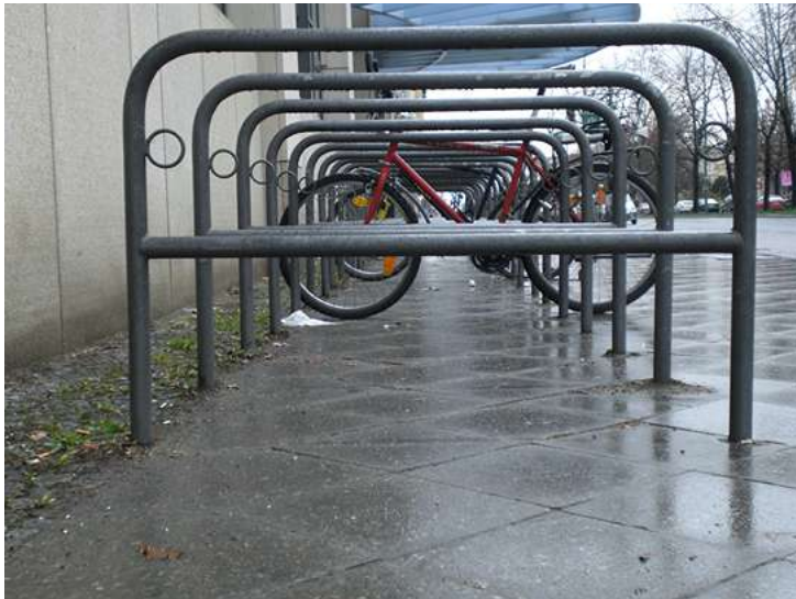
Beispiel Kreuzberger Bügel