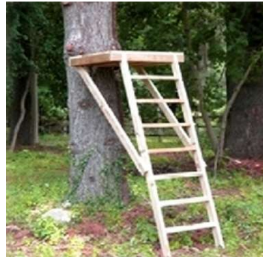
Beispiel Holzwege und Beobachtungssitz