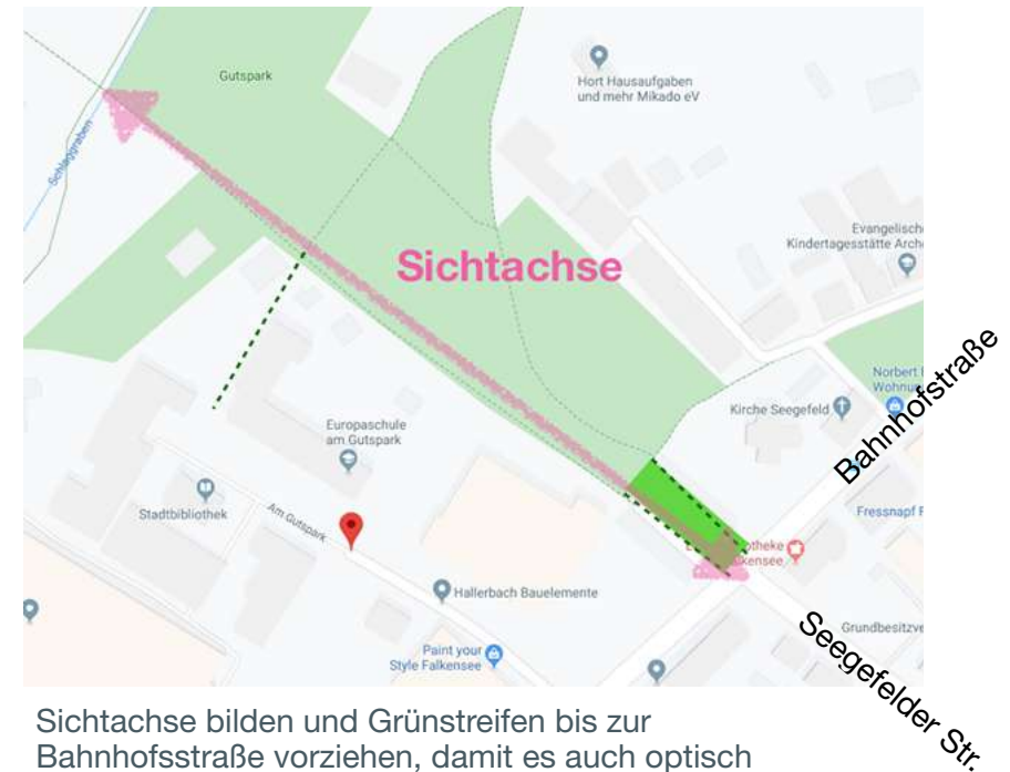
Sichtachse bilden und Grünstreifen bis zur Bahnhofstraße vorziehen, damit es auch optisch einen Zugang zum Park gibt (Google Screenshot, eigene Skizze)