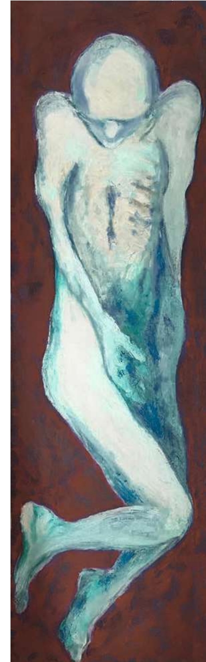
Traum männlich Ölfarbe auf Sperrholz, 160 × 45 cm, 2001