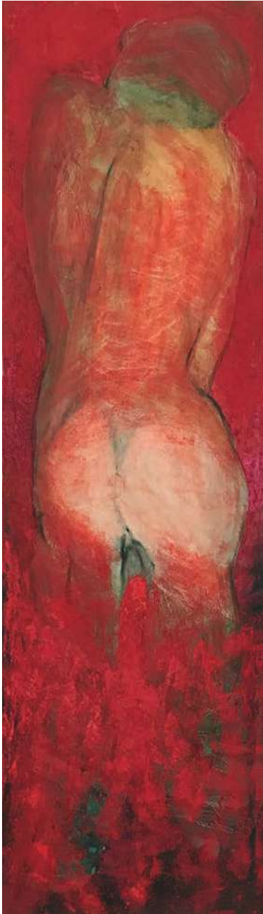
Traum weiblich Ölfarbe auf Sperrholz, 160 × 45 cm, 2001