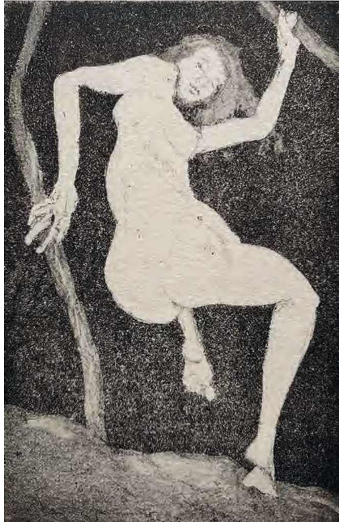
Nachtgestalt Aquatinta, 14,8 × 10 cm, 2020

Jörg Schmidt-Wottrich Jahreswechsel 2020/21 (Corona-Beschränkungen)